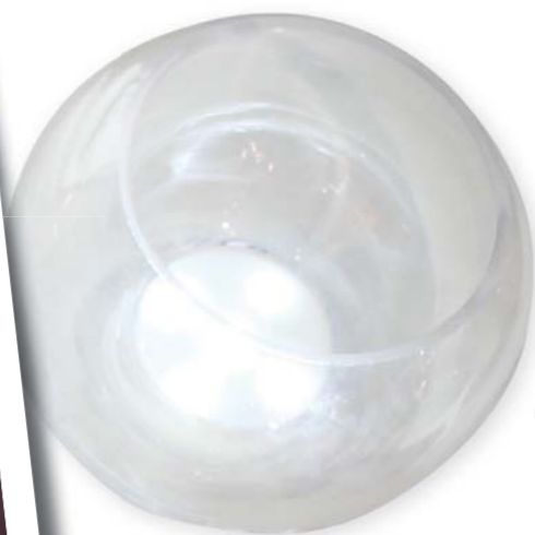
Vase Bubble Crystal Light

Retrouvez nos pas à pas dans notre rubrique inspirations sur claytrons.com