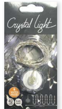
Guirlande LED Crystal Light