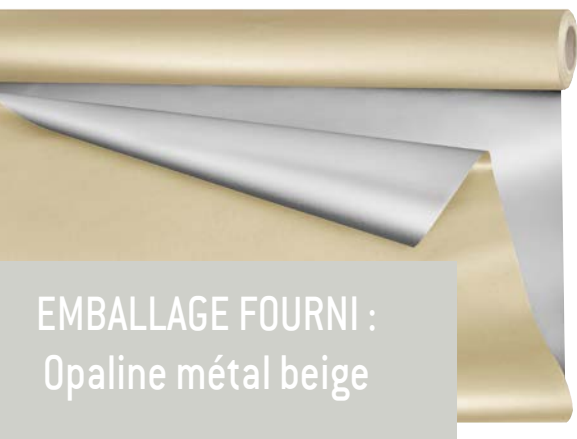
EMBALLAGE FOURNI : Opaline métal beige